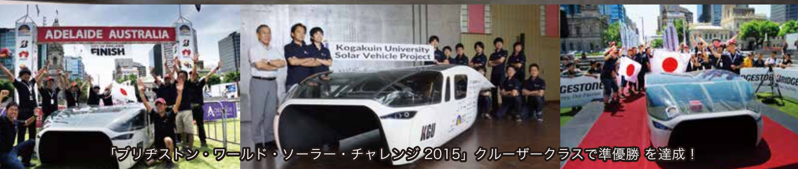
「ブリヂストン・ワールド・ソーラー・チャレンジ2015」クルーザークラスで準優勝を達成！

PRクエストは世界大会にチャレンジする工学院大学のソーラーカープロジェクトの活動を応援しています